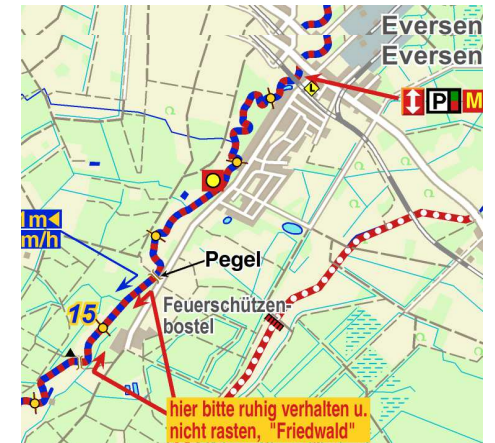
Befahrbarkeit dort fraglich